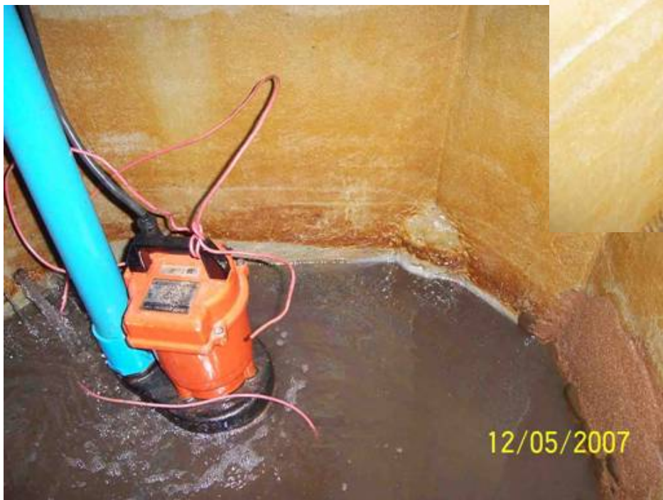
ตำแหน่งรั่วซึมในบ่อ Main Pool