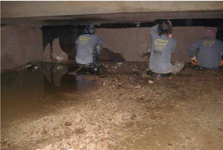
การรื้อผิวผนังกันซึมเดิมที่ หลุตร่อนในบ่อ Main Pool