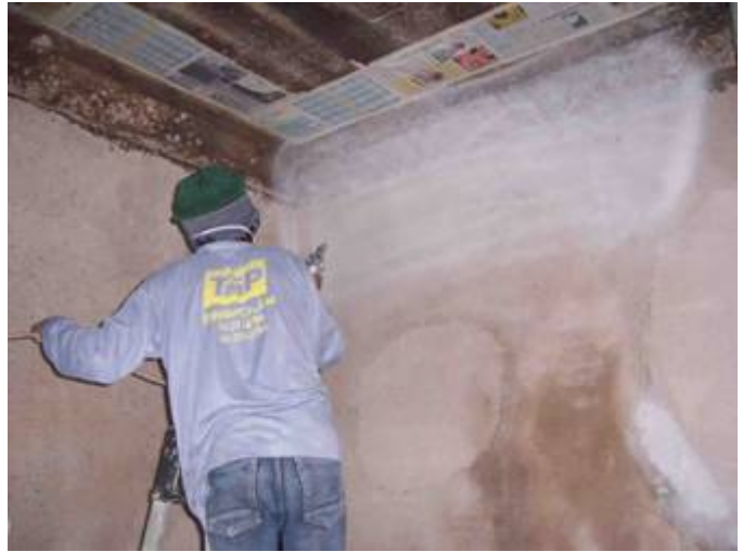
พ่นสีอิพ็อกซี Hydrocote เทียวที่ 2 และ 3